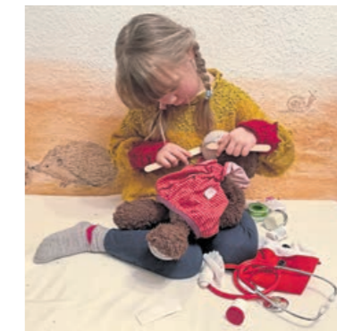
Bild: Kind spielt Arzt aus sozialpädagogischen Bereich

Schulstandort: ▪ Anna-Haag-Schule Backnang